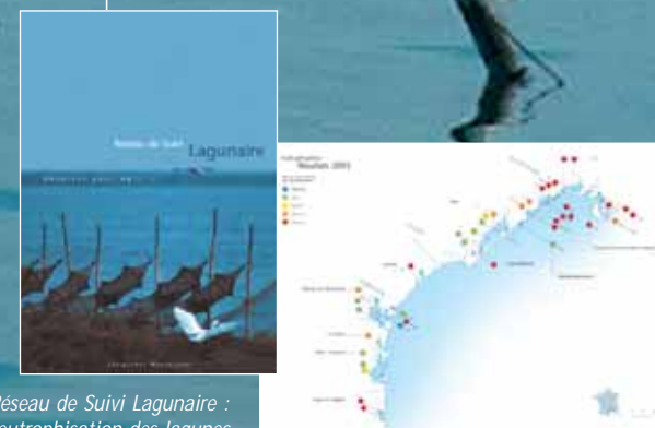
Bulletin du Réseau de Suivi Lagunaire : suivi de l'état d'eutrophisation des lagunes

Interface entre le monde scientifique, professionnel et les institutions, le Cépralmar joue un rôle fédérateur dans la mise en œuvre de réseaux de collecte et de transfert des "connaissances" et des "savoirs" vers les différents acteurs du développement littoral. Dans cet objectif, il organise la concertation entre les acteurs en proposant une restitution adaptée de l'information, afin de favoriser les échanges entre les partenaires. Enfin, il coordonne l'élaboration de réponses appropriées et concertées à destination des collectivités publiques et des professionnels.