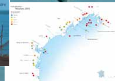
Bulletin du Réseau de Suivi Lagunaire : suivi de l'état d'eutrophisation des lagunes