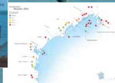
Bulletin du Réseau de Suivi Lagunaire : suivi de l'état d'eutrophisation des lagunes